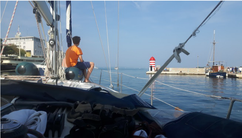
SY Windy lähdössä Zadarin satamasta. Kesäinen viikko Adrianmerellä on alkamassa.

Heräämisiä alkoi tapahtua klo 6 jälkeen. Aikaisin heränneet pääsivät jonottamatta sataman suihkuun ja vessaan. Aamupala veneen avotilassa oli runsas ja aamiaisympäristön mastomeri lumoava. Windy starttasi moottorinsa klo 9 jälkeen ja lipui hitaasti ulos ahtaasta satamasta. Avomerellä asettui vauhti moottorilla 5 solmuun ja suunta kohti Molat saarta. Kukin sai vuorollaan olla ruorissa ja kokeilla ison veneen ajamista. Yksi pariskunta valtasi keulan auringonottoapaikan. Molatin