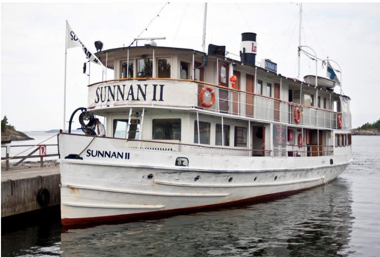
Sunnan II valmistui Varkauden telakalla 1906, se liikennöi Saimaalla mm. Imatra II, Lappeenranta ja Louhivesi nimisenä. Sisävesihöyry on sittemmin dieselöity ja Tammisaaresta tuli sen kotisatama vuonna 1992.

Elokuun 18. valkeni harmaan sumupilven verhotessa taivaan. Sääennusteeseen luottaen tiesimme ettei sadetta kuitenkaan olisi luvassa ja toivoimme taivaan aukeavan iltapäivällä. Lukuun ottamatta niitä toistakymmentä, jotka kertoivat hankkiutuvansa omin kyydein lähtösatamaan väki kerääntyi hyvissä ajoin ennen kymmentä Kiasman eteen – noustakseen tilausbussiin joka veisi Helsingistä Tammisaareen.